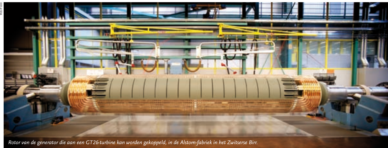
Rotor van de generator die aan een GT26-turbine kan worden gekoppeld, in de Alstom-fabriek in het Zwitserse Birr.

Om tot hogere rendementen te komen brengen de fabrikanten voortdurend kleine verbeteringen aan, bijvoorbeeld in de vorm van de turbineschoepen, zodat die nog wat meer kracht kunnen overbrengen, en in de metalen waarvan de schoepen zijn gemaakt, zodat de gastemperatuur weer wat omhoog kan. De resultaten – het gaat om tienden procentpunten – lijken minimaal, maar tikken op grote getallen toch aan: als een middelgrote centrale van 870 MW stroom levert voor zo'n 900 000 huishoudens, is een duizendste daarvan altijd nog 900 huishoudens.