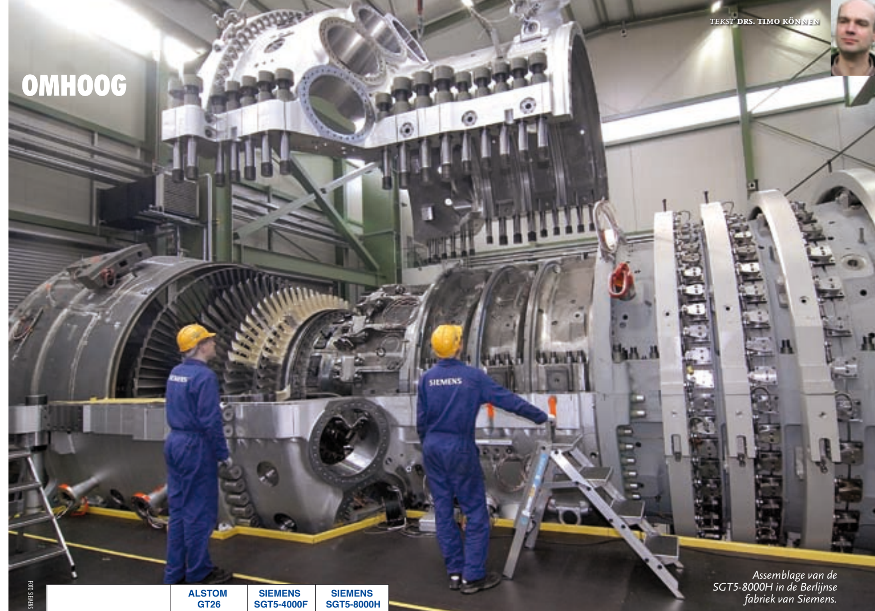
Assemblage van de SGT5-8000H in de Berlijnse fabriek van Siemens.